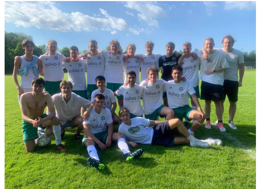
Senior 4 HR